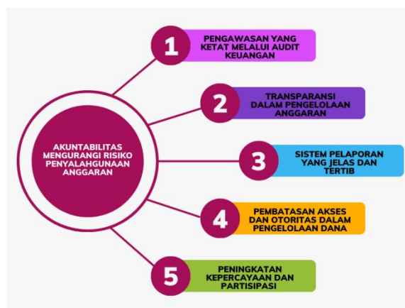
Gambar 1 Mengurangi Risiko Penyalahgunaan Anggaran Strategi

Muti Atus Sofiah, dkk., Strengthening Governance of Education Costs: Towards Transparency, Accountability and Effectiveness pengeluaran yang tidak relevan. 78 Penelitian menunjukkan bahwa organisasi dengan pengelolaan keuangan yang transparan dan akuntabel memiliki tingkat kepercayaan publik yang lebih tinggi dan mampu mencegah penyalahgunaan anggaran secara signifikan 9,10 . Oleh karena itu, Akuntabilitas dalam pengelolaan keuangan memastikan dana digunakan secara efisien dan sesuai tujuan, mencegah penyalahgunaan anggaran, serta menciptakan tata kelola yang transparan, bertanggung jawab, dan berkelanjutan, Begitu juga SMP Plus Darussalam menerapkan prinsip akuntabilitas dalam pengelolaan anggaran dengan memastikan transparansi dan pelaporan keuangan yang jelas kepada seluruh pemangku kepentingan. Strategi ini membantu mengurangi risiko penyalahgunaan anggaran dengan memastikan bahwa dana digunakan sesuai tujuan yang telah ditetapkan dan diawasi secara efektif.